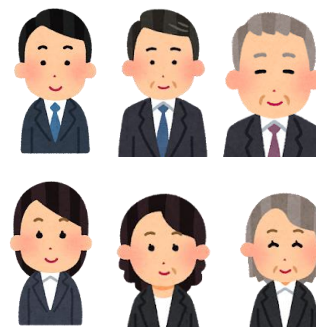
図 1. 6 つのイラスト

サーベイ実験では、図 1 に記載する 6 つのイラスト 5 つの公約を組み合わせた 30 種類の選挙候補から無作為に 5 つ提示し、その中から「誰が若者のための政策を掲げているか」と「誰に投票したいか」を尋ねた。公約の内容として、若者向けである奨学金公約や、若者減税公約、その他年齢に応じて必要が生じるであろう、経済政策公約、社会保障公約、改革公約を用意した。また党派性の影響が生じないように、全て無所属で統一し、氏名は記号の形で表示した。